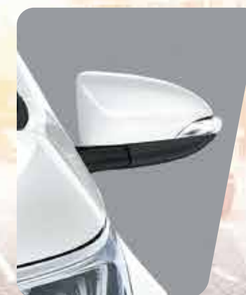
Espejos exteriores retráctiles automáticos con regulación eléctrica y luz de giro 3