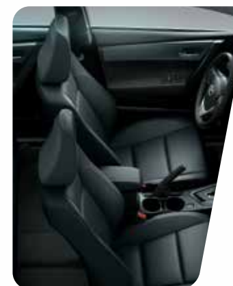
Tapizados de cuero color negro

El nuevo Corolla está especialmente diseñado para hacer más cómodo y placentero el viaje de sus pasajeros. Su gran distancia entre ejes permite que sus ocupantes disfruten de un confort interior inigualable. El renovado interior presenta sus asientos y paneles de puertas cubiertos en cuero natural y ecológico color negro para acentuar el estilo que lo caracteriza.