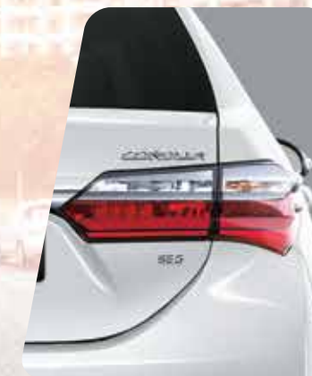
Faros traseros de LED 6