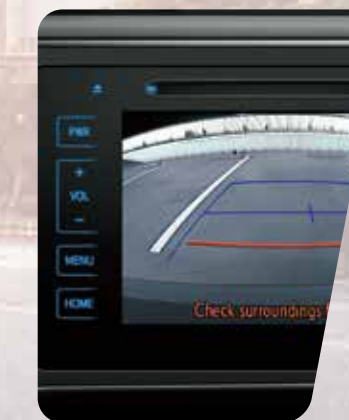
Monitor de cámara de estacionamiento en pantalla LCD de 7" 7