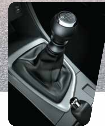
Caja manual de 6 marchas