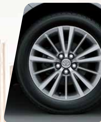
Llantas de aleación de 16" 2