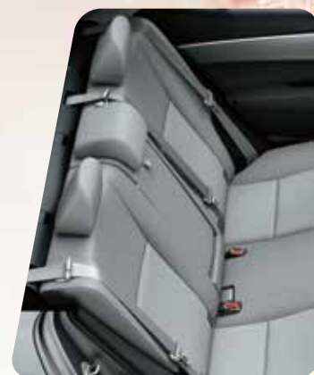
Asientos tapizados en tela gris 4