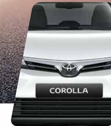
Parrilla delantera cromada