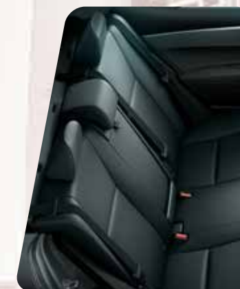
Asientos tapizados en cuero negro 3