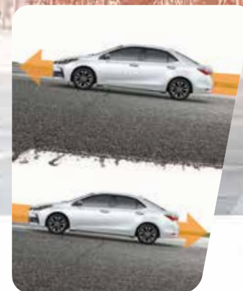
Asistente de arranque en pendientes (HAC)