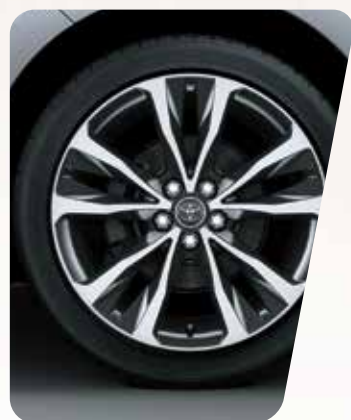
Llantas de aleación de 17" 3