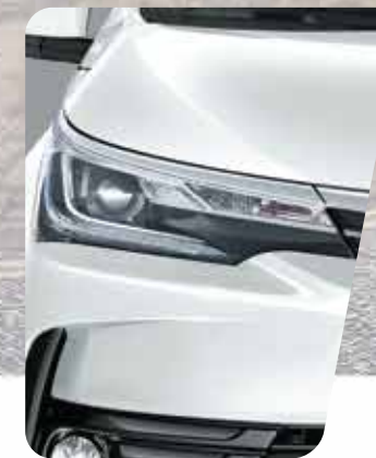
Ópticas delanteras Bi-LED

El nuevo Corolla una vez más reinventa su apariencia con nuevas líneas exteriores. Las llantas de 17" fortalecen su impronta así como también las ópticas de LED, la antena tipo aleta de tiburón y los detalles cromados.