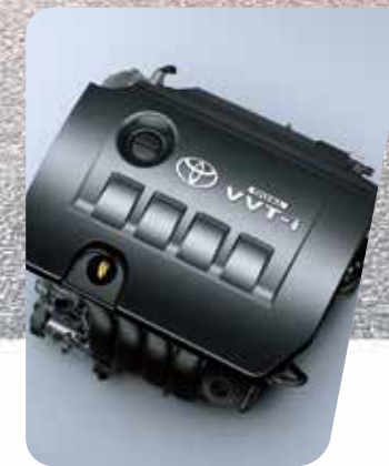
Motor 1.8L Dual VVT-i

El nuevo Corolla se caracteriza también por brindar una sensación única de conducción, tanto en la versión de caja manual de 6 marchas como en la versión de caja automática CVT de 7 marchas. Además, para disfrutar de una conducción más deportiva, las versiones automáticas tope de gama cuentan con Modo Sport y levas al volante.