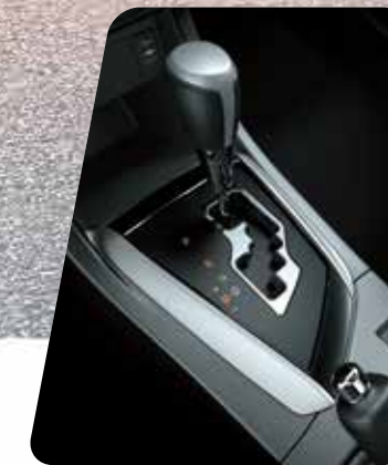
Caja automática CVT de 7 marchas