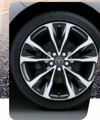
Llantas de aleación de 17"