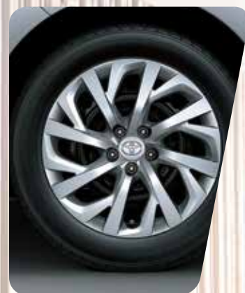
Llantas de acero de 16" 1