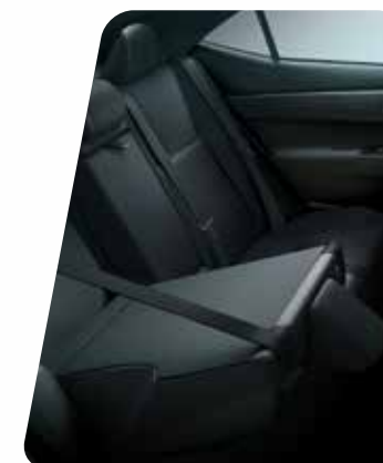
Asientos traseros rebatibles 60/40