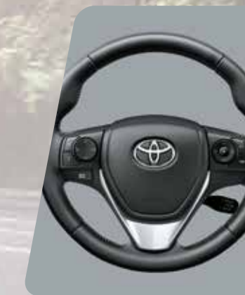
Volante con control de audio, display de información múltiple, teléfono y control de velocidad crucero 8