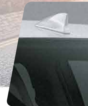
Antena tipo aleta de tiburón