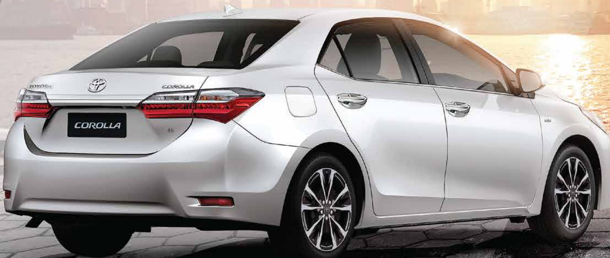
Imagen correspondiente a la versión SE-G.