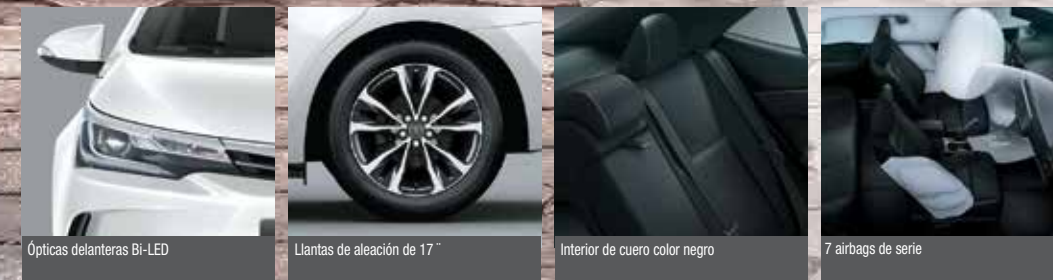
Ópticas delanteras BI-LED Llantas de aleación de 17" Interior de cuero color negro 7 airbags de serie