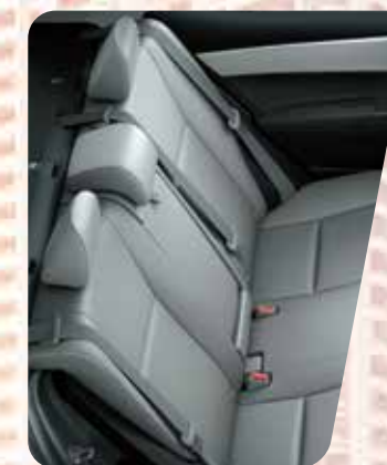
Asientos tapizados en cuero gris 5